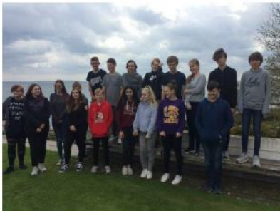
Besuch unserer Partnerschule in Humlebæk 2018